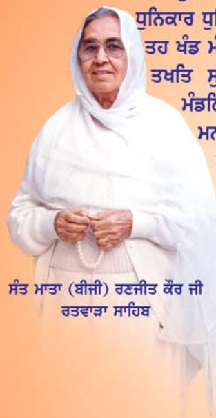
ਸੰਤ ਮਾਤਾ (ਬੀਜੀ) ਰਣਜੀਤ ਕੌਰ ਜੀ ਰਤਵਾੜਾ ਸਾਹਿਬ